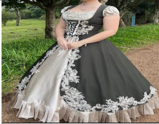
Sem o casaco