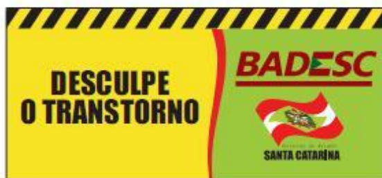
Cavalete de Obra